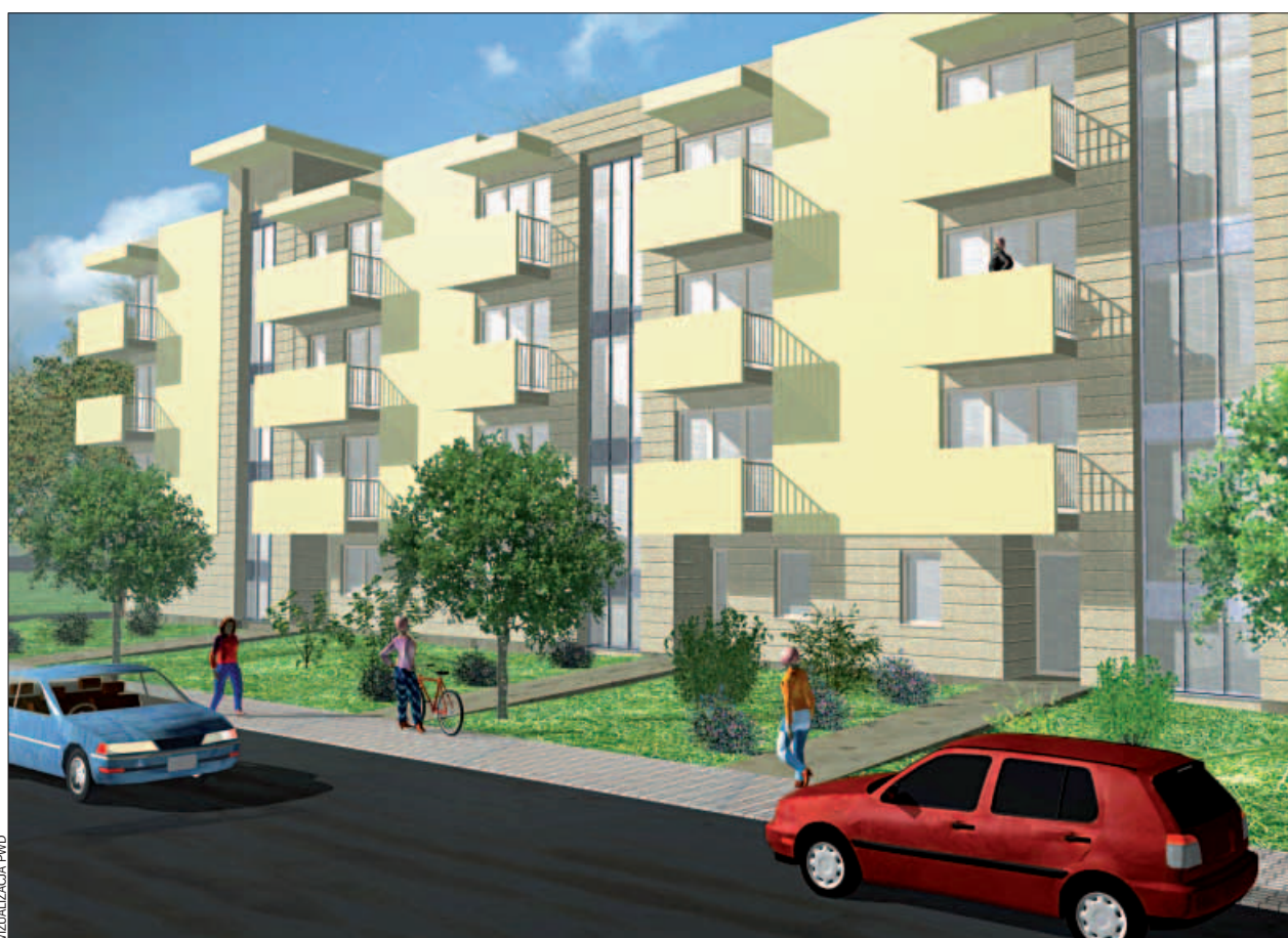
Przeważać będą lokale dwupokojowe o powierzchni od 38 do 56 metrów kwadratowych